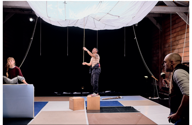
L'art c'est vous , 2024