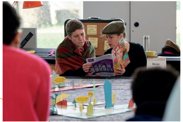
Des nénuphars dans les poumons , 2019

La Compagnie Sans la nommer est conventionnée par le Ministère de la Culture - DRAC Île-de-France depuis 2024.