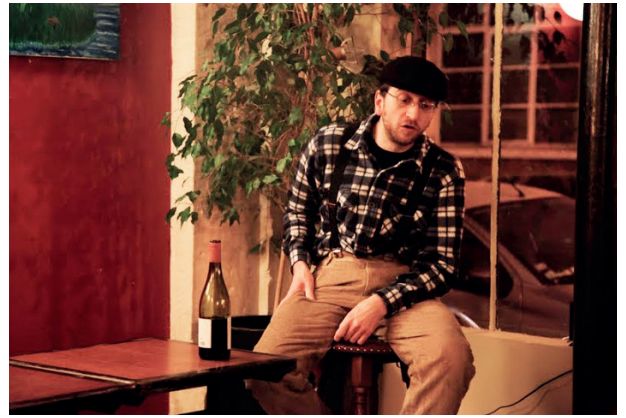
Des bus, des obus, des syndicalistes , 2013

En 2022, Projet 89 sonde ensuite l'expérience intime d'un moment historique à travers les événements de 1989 .