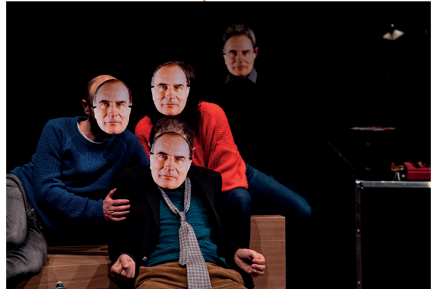
Projet 89 , 2022