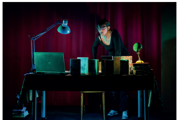
Maothologie , 2017