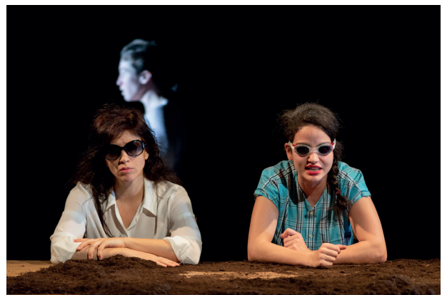
Descendre du cheval pour cueillir des fleurs , 2018