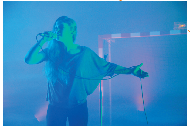
Usine vivante , 2014